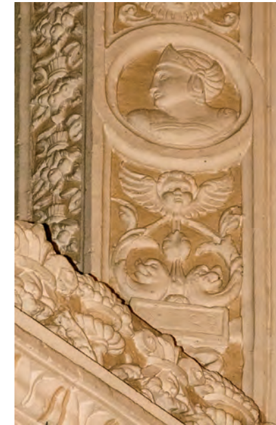
↑ SPQR: Senatus Populusque Romanus en una cartela del derrame de la ventana más septentrional del lado occidental.