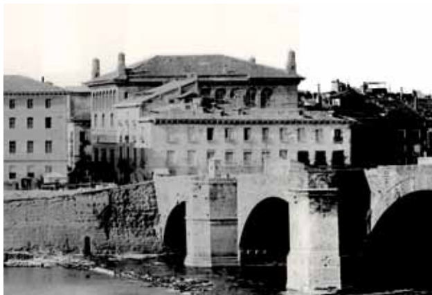
Vista de Zaragoza. Foto de Juan Laurent y Cia. 1877. Instituto del Patrimonio Cultural de España. Archivo Ruiz Vernacci. [Restauración y tratamiento de José Luis Cintora]. Detalle.

Delante de la Lonja, volcadas hacia el río, las Casas del gobierno municipal, con sus dos volúmenes, uno más bajo y antiguo que el otro, junto a la Puerta del puente. Al otro lado de esta, el edificio de la Diputación del Reino.