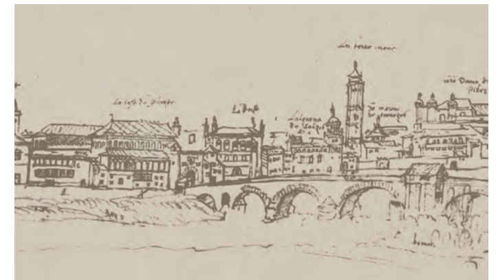
↓ La Borsa. A. van den Wyngaerde. Dibujo preparatorio para la Vista de Zaragoza, 1563. V&A Museum. Detalle.