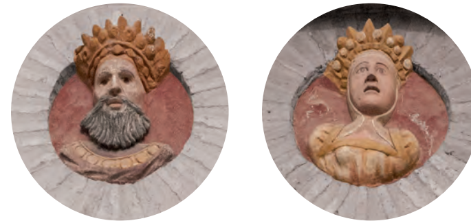
↑ Tondos de la fachada. Fernando el Católico e Isabel la Católica.