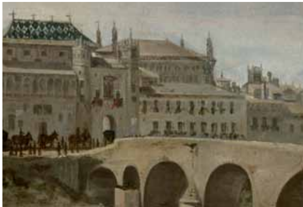
Vista de Zaragoza de Juan Bautista Martínez del Mazo. 1647. Museo del Prado. Detalle.

Recién terminada la Lonja, el autor la dibujó eliminando de delante las Casas del gobierno municipal o Casas del puente a las que se había adosado, prueba de la importancia que otorgó al nuevo edificio.