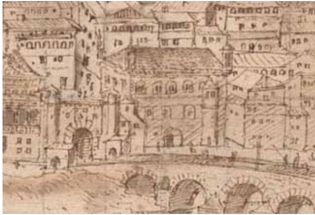
Vista de Zaragoza de A. van den Wyngaerde. 1563. Biblioteca Nacional de Austria, Viena. Detalle.

Recién terminada la Lonja, el autor la dibujó eliminando de delante las Casas del gobierno municipal o Casas del puente a las que se había adosado, prueba de la importancia que otorgó al nuevo edificio.