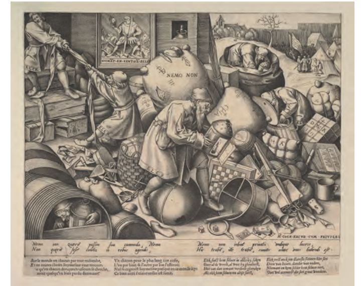
↑ Nadie. Pieter van der Heyden, a partir de Pieter Brueghel el viejo. Metropolitan Museum.