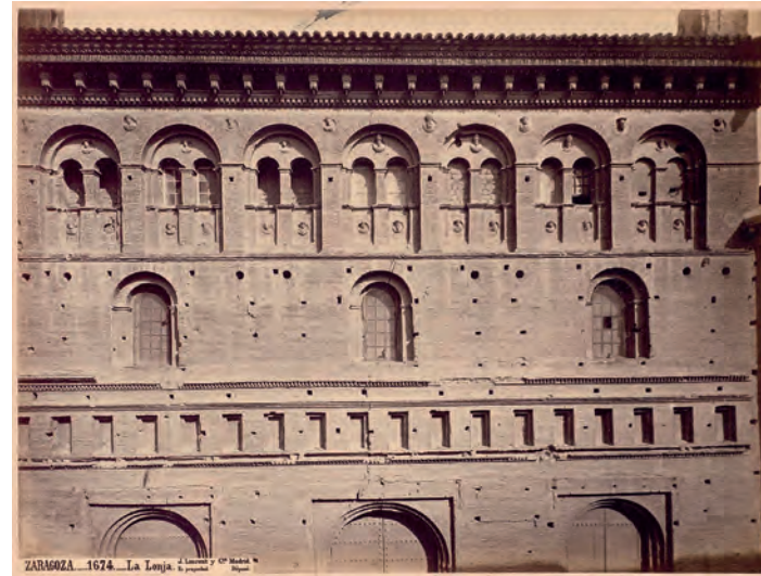
Fotografía de la fachada principal, 1877.