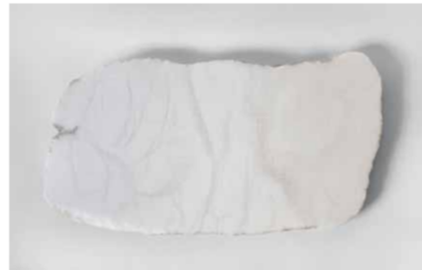
Sin título 2023 Punta seca sobre alabastro 48 x 25 x 2,5 cm