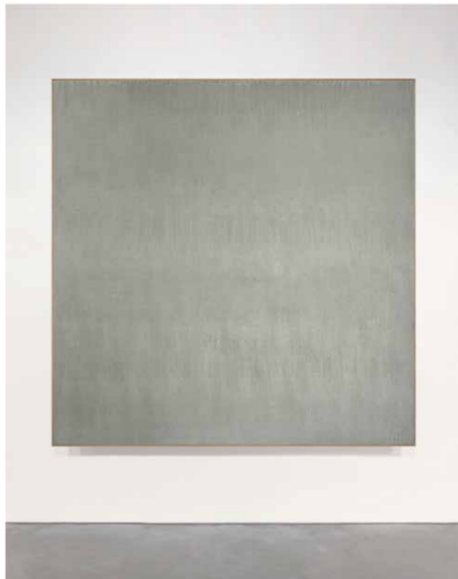
Sin título 2021 Gesso, pigmento y punta de oro sobre madera 100 x 100 cm