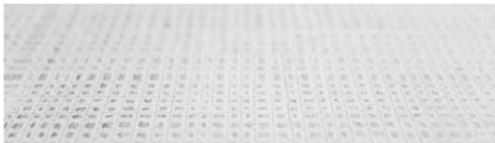
Sin título 2018 Gesso y punta de cobre sobre papel Arches (600 g) 30 x 30 cm