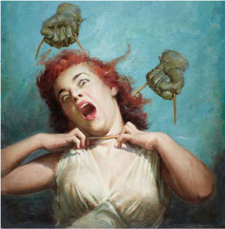
Dibujo para la portada de una de sus novelas