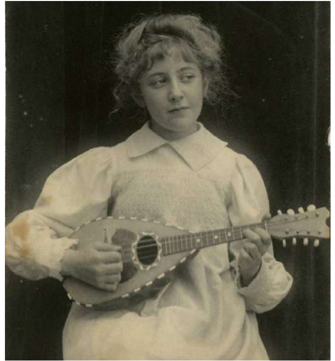
Fotografía de infancia de Agatha Christie