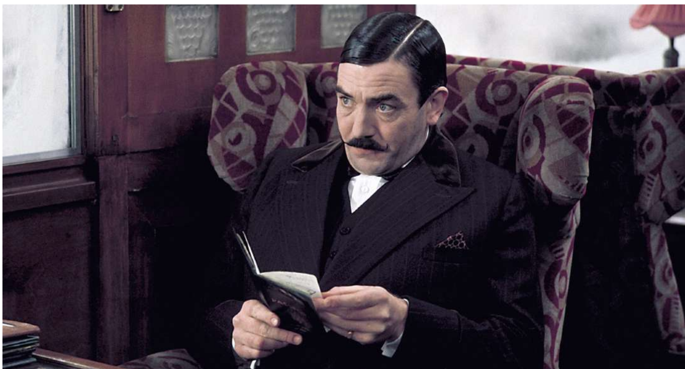
El actor Albert Finney como el detective Hercules Poirot en el film "Asesinato en el Orient Express" (1974)

Por vez primera en España se lleva a cabo una amplia exposición de una de las mujeres más influyentes en la cultura contemporánea en la que el público va a tener la oportunidad de adentrarse en la vida y obra de la escritora británica más célebre de todos los tiempos.