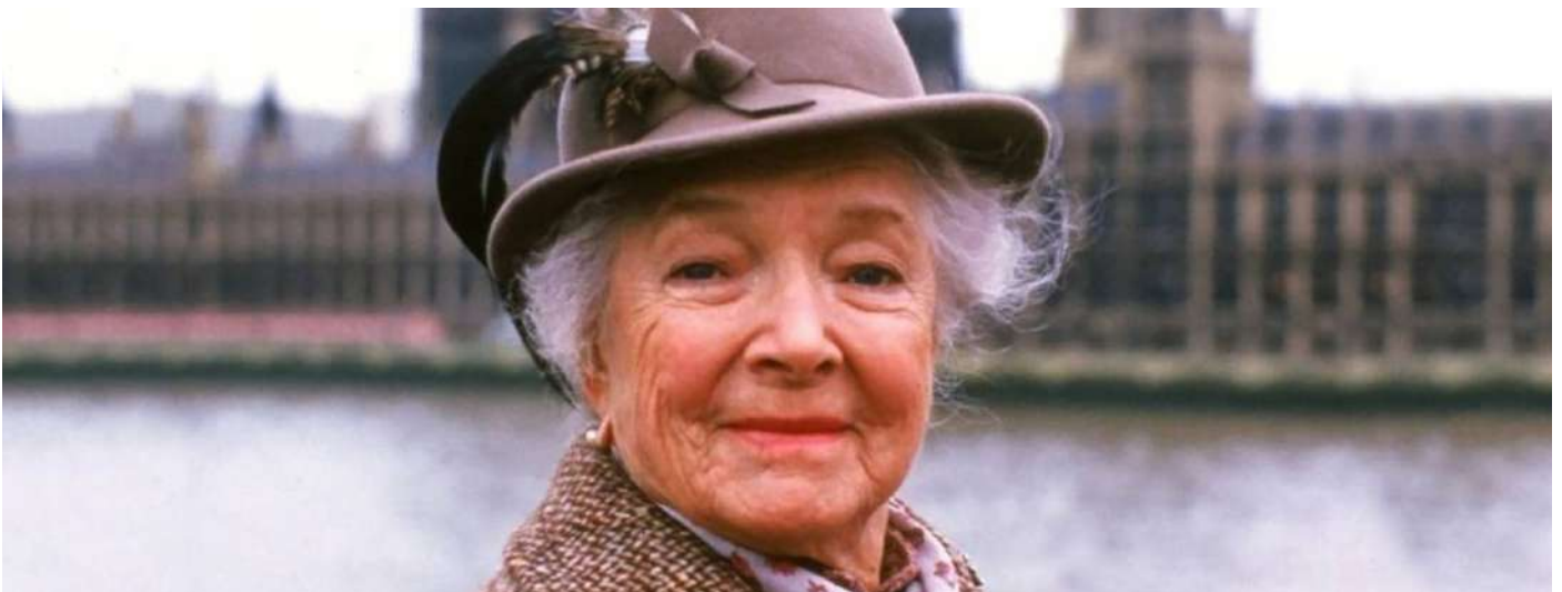
Geraldine McEwan dando vida a Miss Marple para la serie homónima de televisión