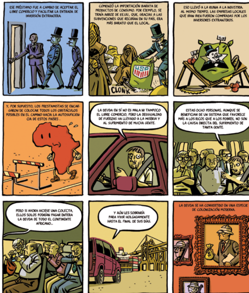
ROCA, PACO La pegajosa deuda. Confesiones de un hombre en pijama, Pág. 7 2017 Astiberri (Bilbao)