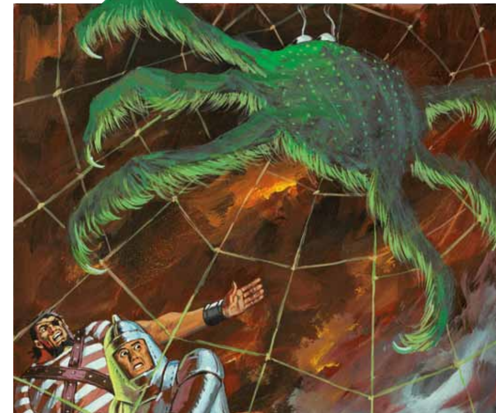
BERNAL ROMERO, ANTONIO. El castillo alucinante, 1971 N° 113 Trueno color Bruguera [Barcelona]