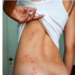
Lesiones producidas por picaduras de chinches.