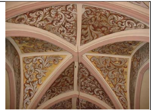
VILLAMAYOR.- Ermita de la Virgen del Pueyo . según Heredia Lagunas, arquitectos