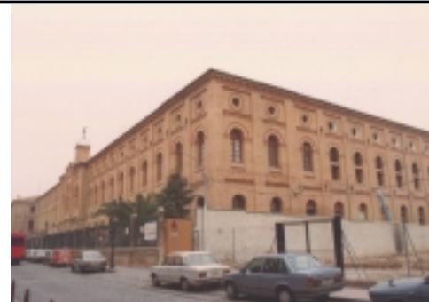
PROYECTO DE CASA DE AMPARO