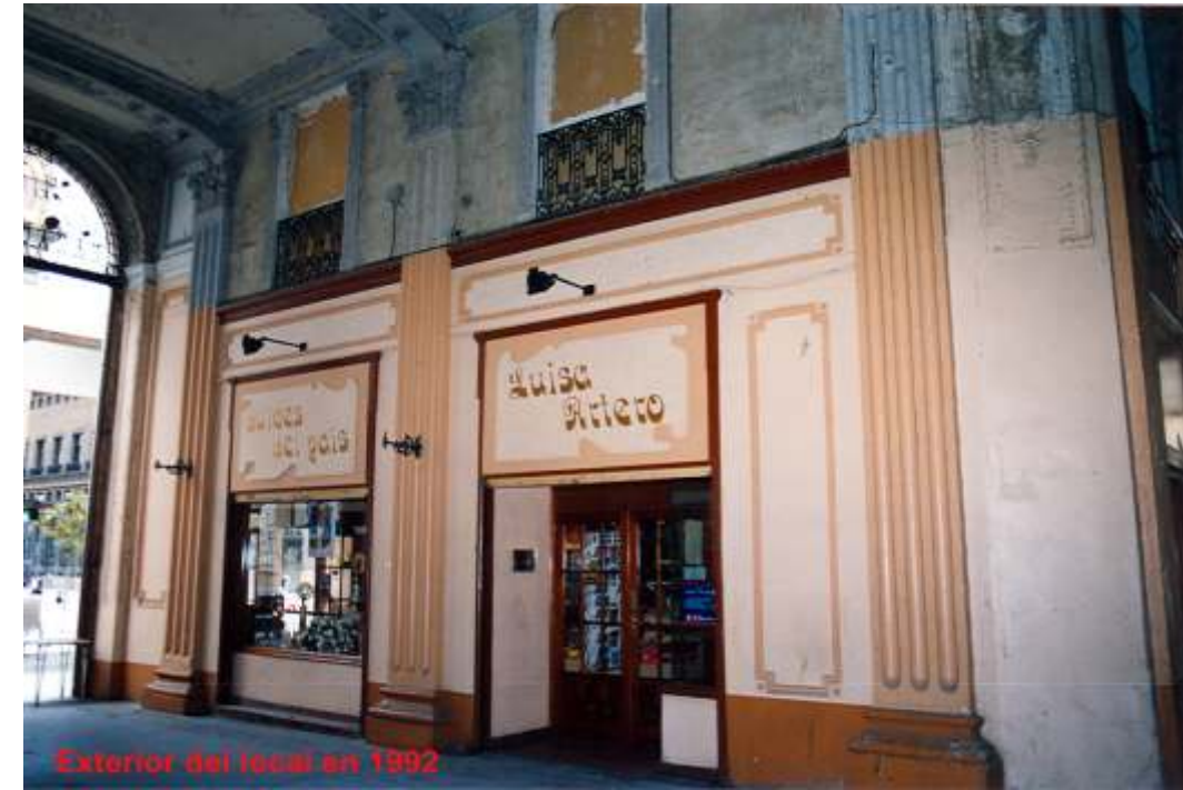
Exterior del local en 1992

YESTE NAVARRO., I., La reforma interior. Urbanismo zaragozano contemporáneo. Zaragoza 1998.