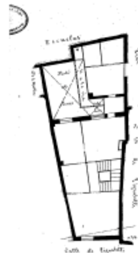
PLANO PARCELARIO DE ZARAGOZA Dionisio Casañal Zapatero

Calle de Pignatelli Barrion de Plan de planta para el Propósito de alerido por