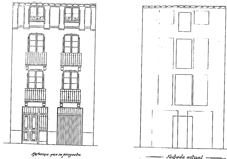
Fachada que se proyecta