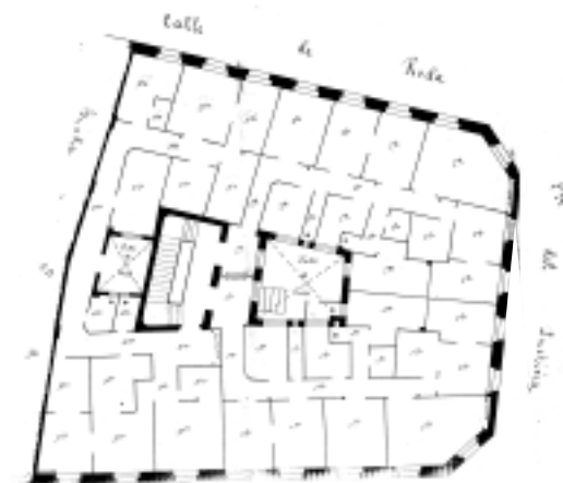
PLANO PARCELARIO DE ZARAGOZA Dionisio Casañal Zapatero

INTERVENCIONES PERMITIDAS Y ELEMENTOS A CONSERVAR. REHABILITACIÓN INTEGRAL FACHADA, CAJA DE ESCALERAS, COLUMNA DE FUNDICIÓN, CERRAJERÍAS, CAJA DE ASCENSOR, CARPINTERÍAS, LAPIDA CONMEMORATIVA (MARIANO DE CAVIA) EN LOCAL COMERCIAL