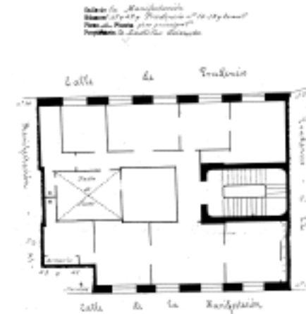
PLANO PARCELARIO DE ZARAGOZA Dionisio Casañal Zapatero

INTERVENCIONES PERMITIDAS Y ELEMENTOS A CONSERVAR.