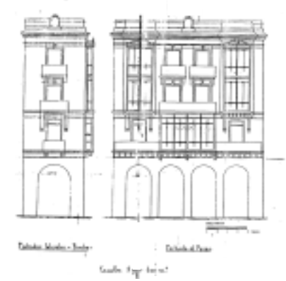
Fachada Principal - Interior

INTERVENCIONES PERMITIDAS Y ELEMENTOS A CONSERVAR. REHABILITACIÓN FACHADA Y CERRAJERÍAS