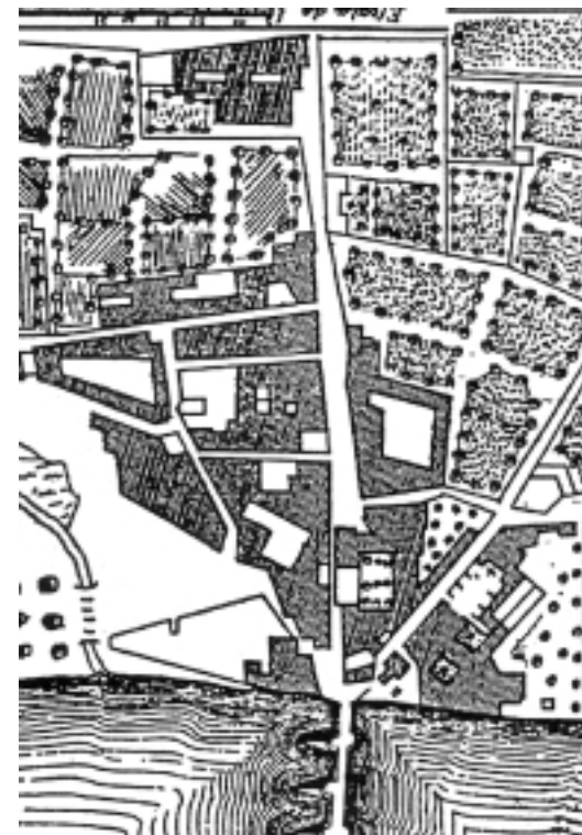
Barrio del Arnehil Plano de Zaragoza englos Carlos Casanueva, 1769

INTERVENCIONES PERMITIDAS Y ELEMENTOS A CONSERVAR.