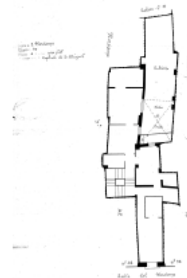
PLANO PARCELARIO DE ZARAGOZA Dionisio Casañal Zapatero

INTERVENCIÓNES PERMITIDAS Y ELEMENTOS A CONSERVAR.