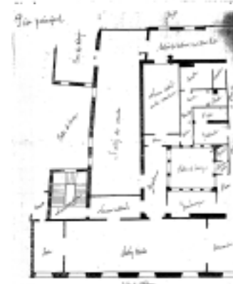
PLANO PARCELARIO DE ZARAGOZA Dionisio Casañal Zapatero