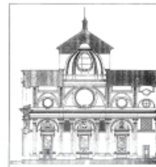
Plano de la Fachada de la Santa Cruz. Autor: Agustín B. Borobio.