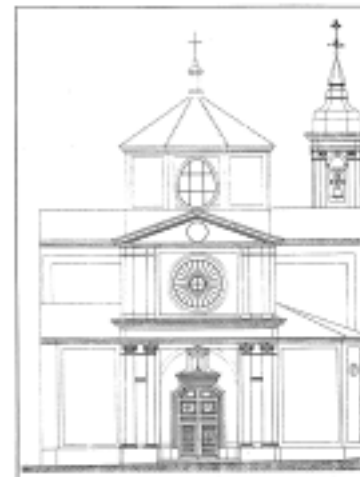
Plano de la Fachada de la Santa Cruz. Autor: Agustín B. Borobio.