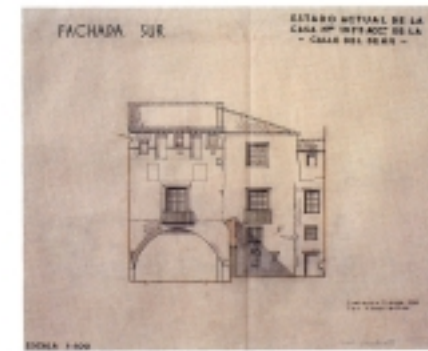
Casa del Deán Plano de estado actual, 1948 Teodoro Ríos Balaguer y Teodoro Ríos Usón