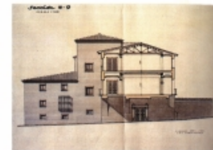
Casa del Deán Plano de proyecto, 1954 Teodoro Ríos Balaguer y Teodoro Ríos Usón