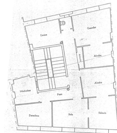
PLANTA DE LOS PISOS Escala: 1:50 mts?