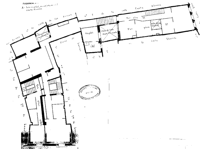
PLANO PARCELARIO DE ZARAGOZA Dionisio Casañal Zapatero

Propiedad de... A. Sala principal, en un plano... Caja Almacén