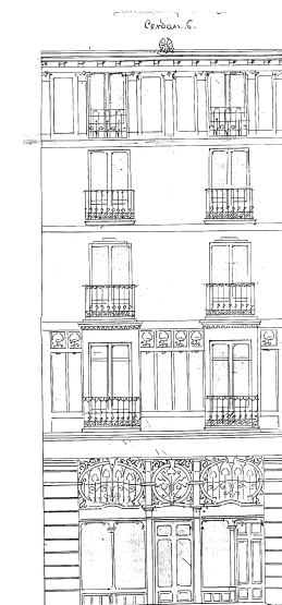
Sec. 001. Casa de S. Eduardo Calavia