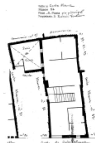
PLANO PARCELARIO DE ZARAGOZA Dionisio Casañal Zapatero