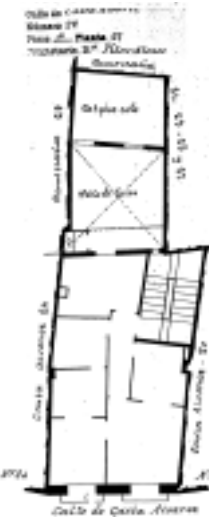
PLANO PARCELARIO DE ZARAGOZA Dionisio Casañal Zapatero

Escudo de la casa Escuela de la casa Escuela de la casa