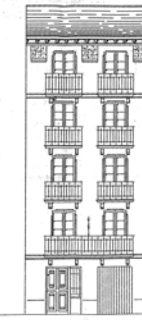
Fachada que se proyecta