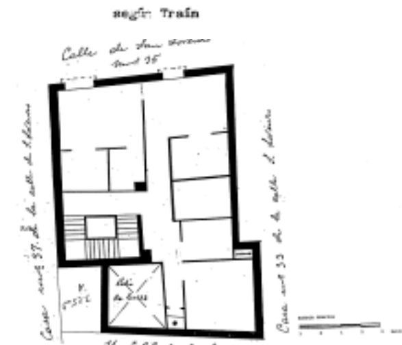
PLANO PARCELARIO DE ZARAGOZA Dionisio Casañal Zapatero

INTERVENCIONES PERMITIDAS Y ELEMENTOS A CONSERVAR. REHABILITACIÓN DE FACHADA