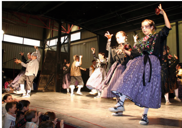
Nuevo centro de folklore aragonés y la jota