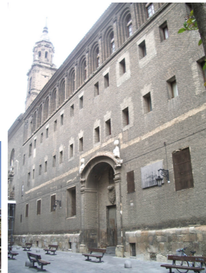
Seminario de San Carlos