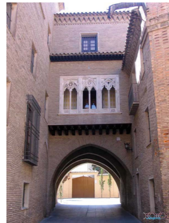
Arco del Dean