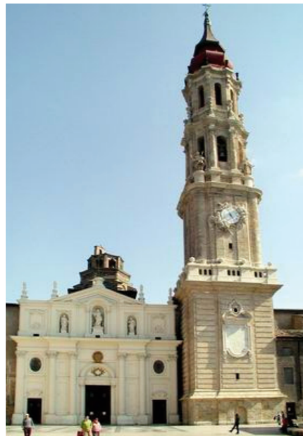
Catedral de La Seo