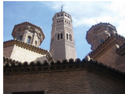
Iglesia de San Pablo