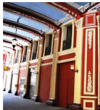
Revitalización de los pasajes