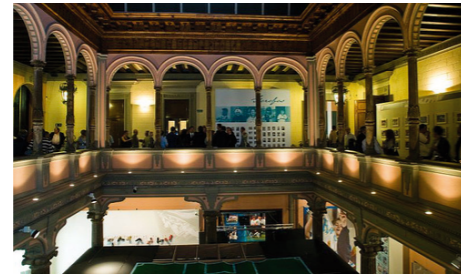
Patios Mágicos. Actividades