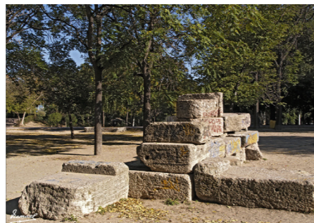
Parque Bruil. Potenciar actividades