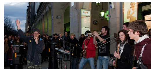
Actividades en las plazas