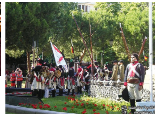
Plaza de Los Sitios. Programa "Emplázate"