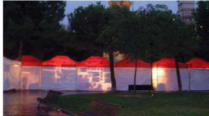
Actividades en los parques

Paseo Independencia Actividades múltiples