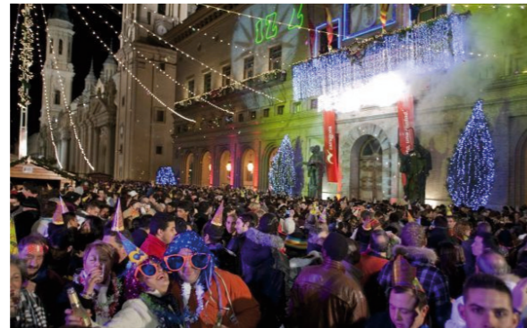
Plaza del Pilar. Programa "Emplázate"