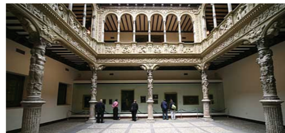
Actividades en los patios. Patios Mágicos