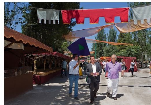
Parques, usos y actividades múltiples