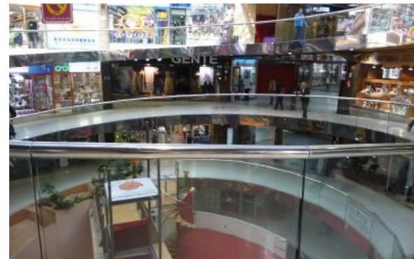
Revitalización de los pasajes