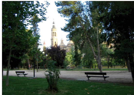
Arboleda de Macanaz. Potenciar el ocio y la cultura