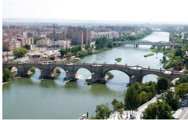
Actividades en las orillas y los puentes