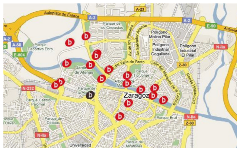
Continuar y ampliar el programa Bizi