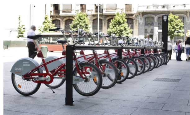
Fomentar el uso de la bicicleta

Apoyo a la idea de zonas 30, zonas pacificadas con prioridad bicicleta, creando supermanzanas amables. Se señalarán los accesos a dichas supermanzanas con resaltes, continuidad de aceras y señalización. Se deberá aumentar el parque de bicicletas y estaciones de bicicletas del programa BIZI.