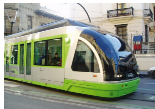
Tranvía, línea Norte-Sur