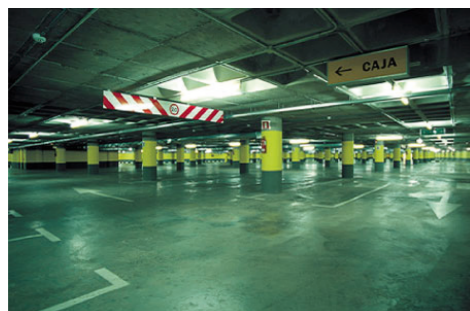
Nuevos aparcamientos subterráneos