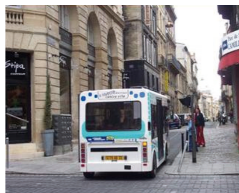
Microbus ecológico. Conexión Este-Oeste entre barrios del C. H.