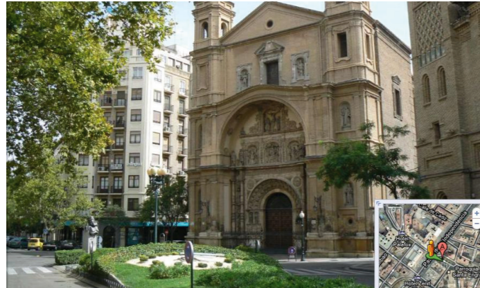
Plaza Santa Engracia. Itinerario Este-Oeste 4