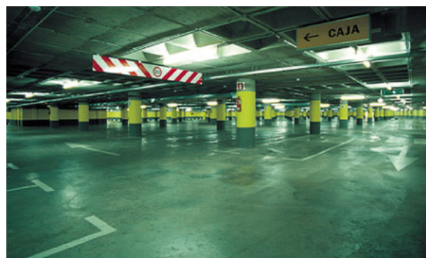
Nuevos aparcamientos subterráneos