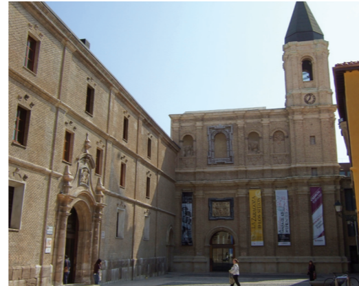
Convento de San Agustín. Itinerario Este-Oeste 1