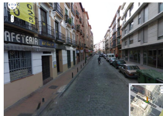
Calle Predicadores. Itinerario Este-Oeste 1