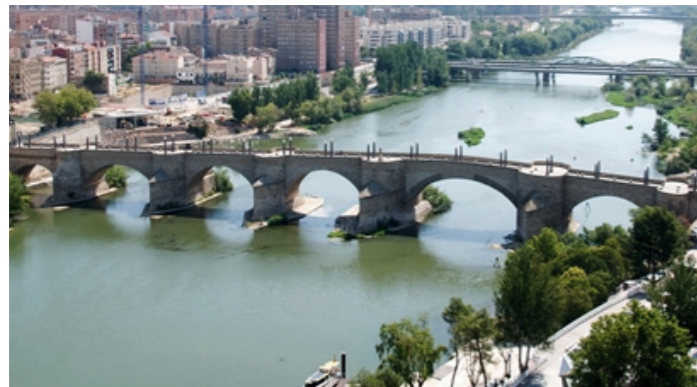
Riberas del río. Itinerario Este-Oeste