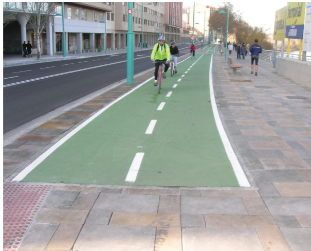
Paseo Echegaray y Caballero, itinerario Este-Oeste