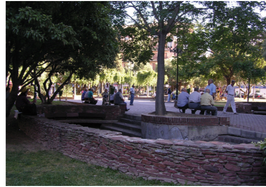
Reformas de la Plaza Salamero