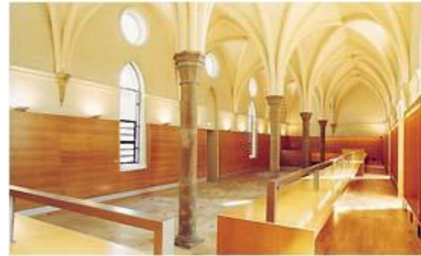
Biblioteca del Agua