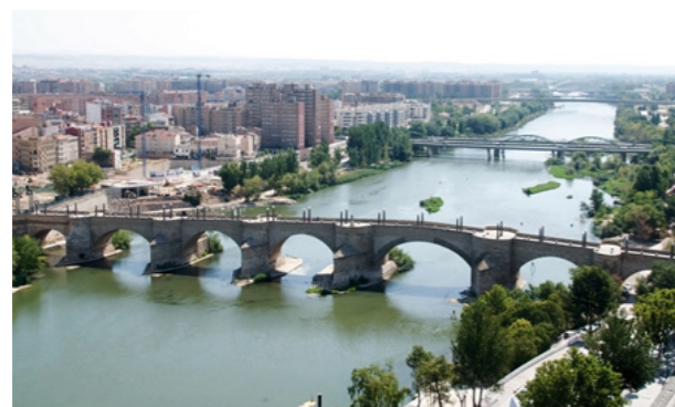
Actividades en los puentes