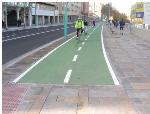
Tratamiento blando en Paseo Echegaray