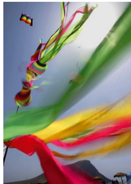
Festival de cometas