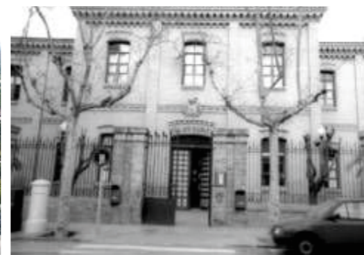
Instituto Luis Buñuel, Centro Cultural del Ebro