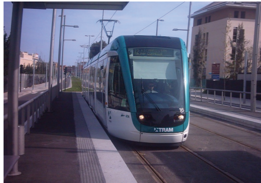
Puente de Santiago, tranvía