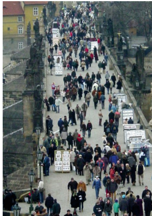
Puente de Piedra, Domingo sin coches