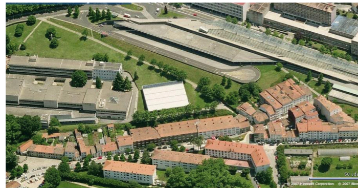
Recepción de visitantes y aparcamiento en S. de Compostela