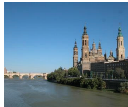
Rehabilitación de las fachadas del río