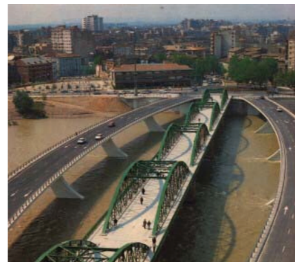
Reforma del Puente de Hierro. Un centro de actividad y ocio.