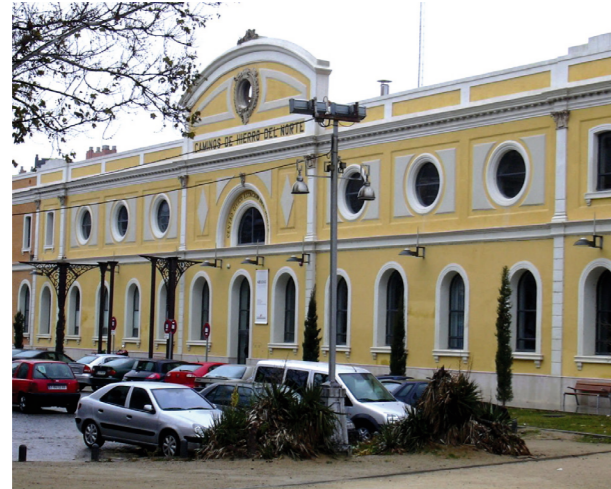
Estación del Norte. Equipamiento de ciudad.