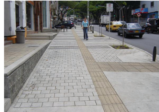
Eliminación de barreras