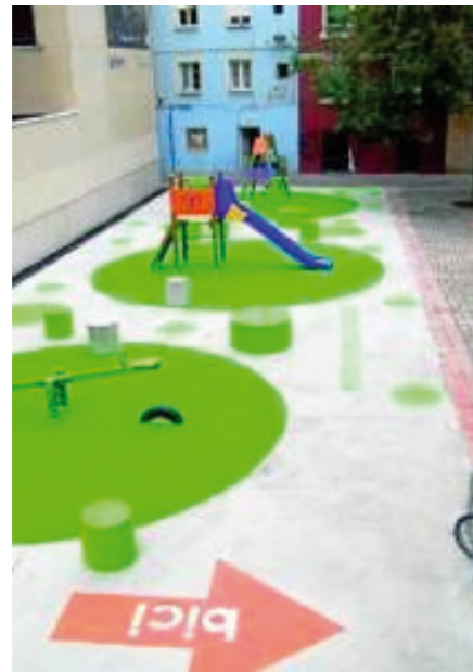
"Esto no es un solar"