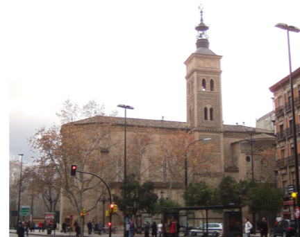
Mejora de la Plaza de San Miguel