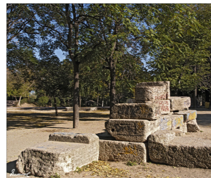
Mejor accesibilidad al Parque Bruil

3. Mallar el Centro Histórico con recorridos verdes uniando plazas. Creación de dos anillos verdes, incorporando el Parque Lineal del Ebro.