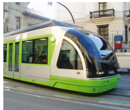
Apuesta por el transporte público

9. Solares, se continuará con la política de registro de solares para incentivar su construcción. Mientras tanto se continuará con el programa "esto no es un solar" , que tan buenos resultados está obteniendo desde diversos puntos de vista: social, económico, paisajístico.