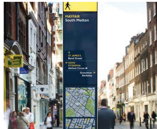
Señalización de itinerarios