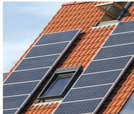
Mejora en la eficacia energética de la edificación.