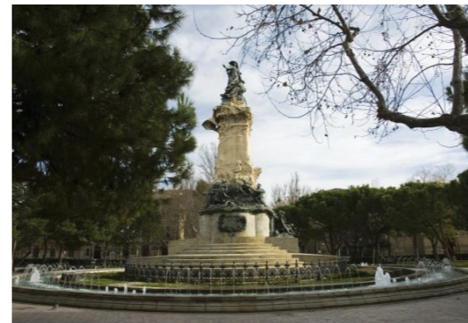
Mejora del entorno urbano