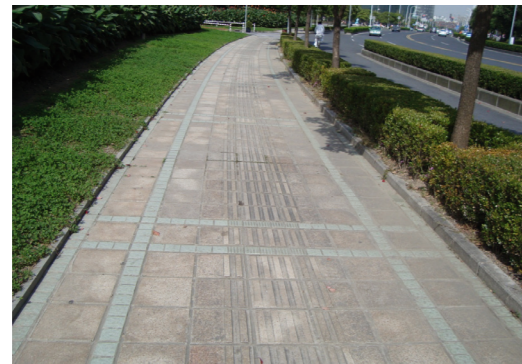
Lineas de vida para invidentes