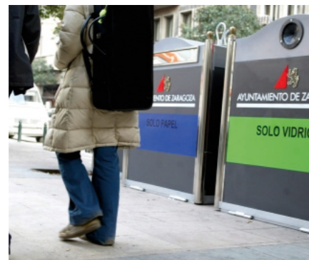
Reciclaje de residuos