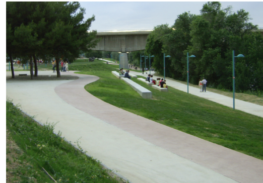
Comunicación del Centro Histórico con los parques del entorno.