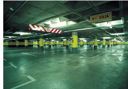
Nuevos aparcamientos subterráneos