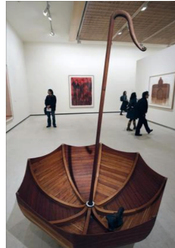
Arte latinoamericano. Colección Daros