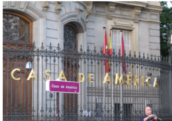
Casa América de Madrid