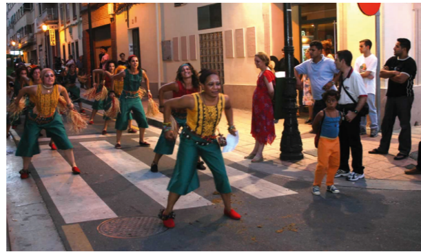
Carrera del Gancho