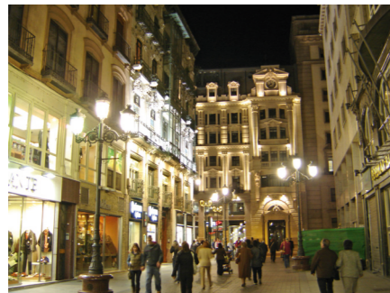
Peatonalización de calles