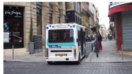
Minibus ecológico del Centro Histórico