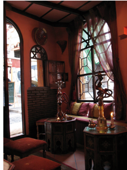
Locales con encanto