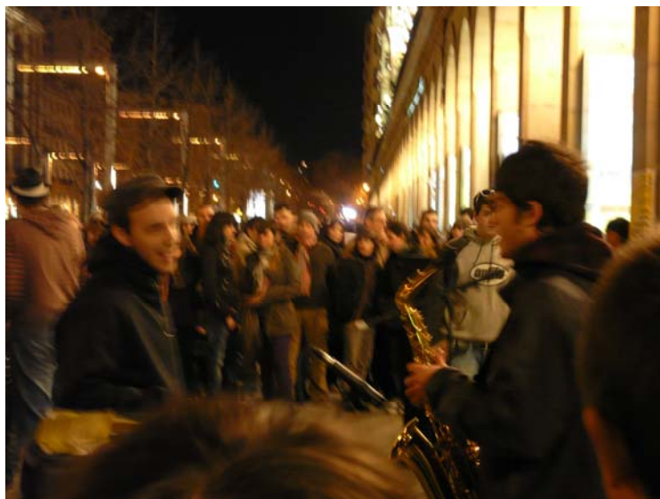
Músicos en el Paseo de la Independencia.

Hasta que se inaugure el tan ansiado Espacio Goya, se podrían realizar talleres artísticos, Residencia o becas de artistas en la antigua Escuela de Artes.