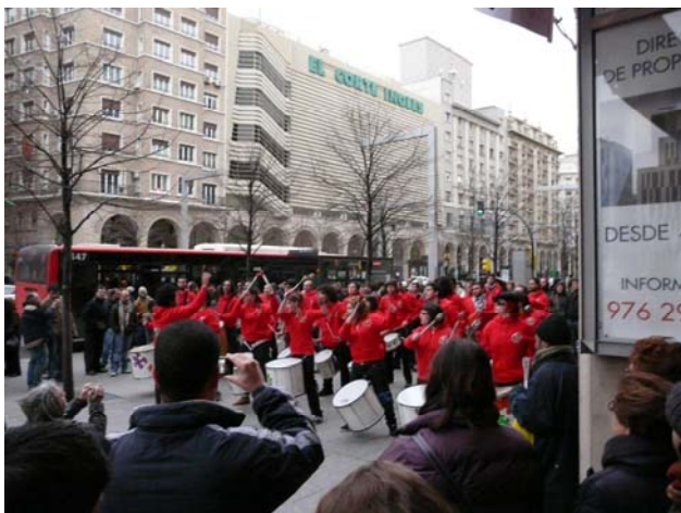
Batucada en el Paseo de la Independencia

Museo de la paz. Albergará como preludio toda la colección de piezas y objetos del proyecto fallido de museo de los sitios de Zaragoza. Colección fotos Gervasio Sánchez. Aspectos negativos de la guerra y positivos de la paz con espacio reservado a las ongs que desarrollan su trabajo en Aragón. Ejemplo del Pabellón del faro en Expo 2008.