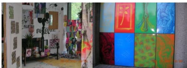
Escuela de Bellas Artes y decoración callejera en Londres.