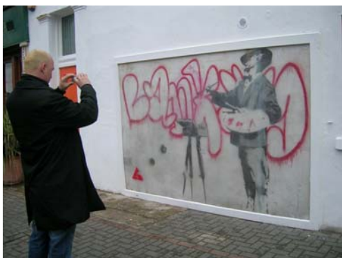
Graffiti de Banny en Portobello –Londres-.

En Londres, los graffitis de Banny –artista de Bristol- se están preservando y conservando por su atractivo turístico y por supuesto por su gran valor artístico. Para ello, están enmarcándolos y protegiéndolos con paneles transparentes de metacrilato.