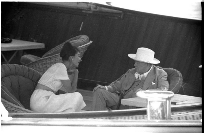
Maria Callas y Sir Winston Churchill a bordo del yate Christina O de Onassis. Puerto de Mónaco 1959.

La exposición incluye una sección con personalidades de la jet-set que marcaron la época de la riviera francesa, desde Onassis, Winston Churchill, Kennedy, Gianni Agnelli, Aga Khan, el duque de Windsor, la princesa Soraya, el sha de Persia, Gunter Sachs... y muchos más.