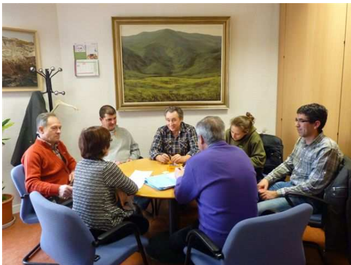
Coop San Lamberto As. Hortelanos