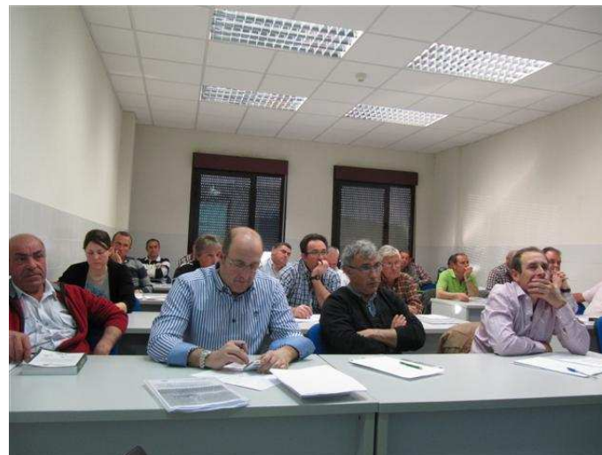
Hortelanos en Mercazaragoza