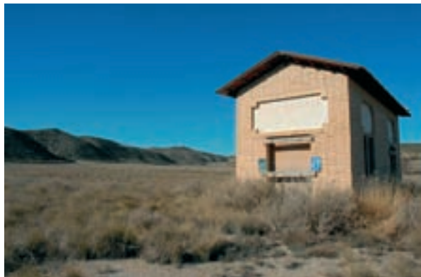
Edificio que alberga el manantial

En la forma parenquimatosas como es tan grande el poder colagogo y colerético de esta agua, produce una gran descarga del parenquima hepático dejando a este en las mejores condiciones para normalizar su función, a todo esto se añade su acción laxante de tanta importancia en la desintoxicación del organismo. Contra la Angiocoli-