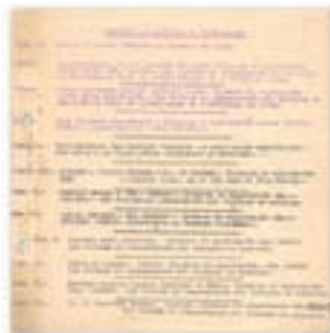
Registro de licencias de exportación

Como referencia de todo este esplendor internacional nos puede servir el siguiente texto, reproducción de una hoja original de registro que todavía se conserva de las oficinas de la calle Sacramento, probablemente correspondiente al año 1946: