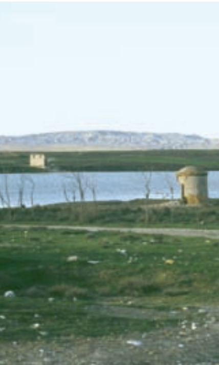
Pozo Mediana y casa Rubinal-Condal todavía en pie, año 1986