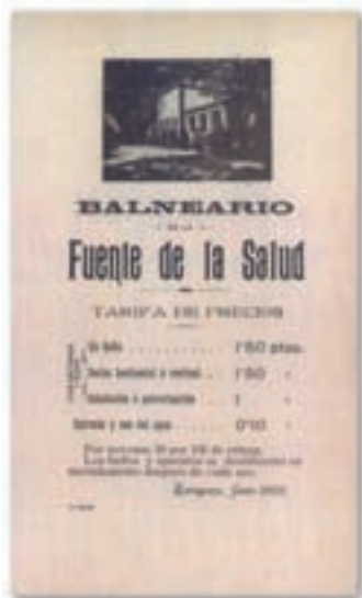
Folleto de 1903

Pago de arbitrios al Ayuntamiento de Zaragoza por el análisis de las aguas: 100 pesetas