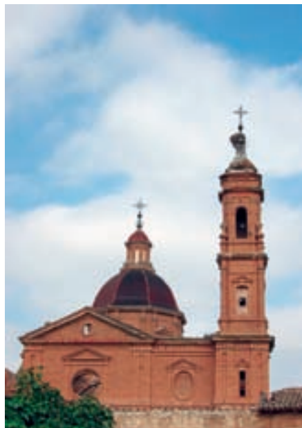
Perfil del Monasterio de Santa Fe

Las construcciones que persisten el paso del tiempo son un taller-almacén (en muy mal estado) y el pozo propiamente dicho: un edificio de ladrillo rectangular de unos 8 por 4 metros, donde todavía se distingue el viejo cartel de "Fita de Santa Fe, Zaragoza" y en cuyo interior se encuentra el pozo (de unos 13 metros de profundidad) y restos del dispositivo de captación. Unas escaleras de madera conducen al sótano, dividido en dos partes, el orificio del pozo y una sala para trabajar, que se llega a inundar en determinadas ocasiones. Originariamente la planta sótano quedaba al nivel máximo del agua y un muro separaba la sala del pozo propiamente dicho, tan sólo con una pequeña ventana practicada en el muro como acceso en caso de averías de la instalación de elevación.