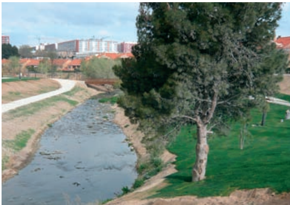
Entorno de la Junquera en la actualidad

El recuerdo del esparcimiento dominguero