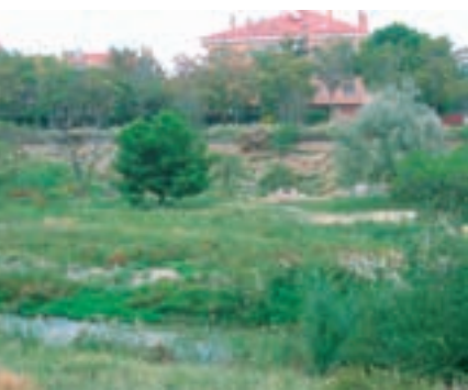
La fuente con la pradera y el río

El siglo XXI recibe una Fuente de la Junquera salvada in extremis de la urbanización, que llega hasta el mismo talud. En el talud se aprecian plantas esteparias-yesíferas y el entorno junto al río presenta árboles repoblados (pinos y árboles ornamentales) junto a plantas de escasa relevancia. El barranco de La Junquera aparece desembocando en el meandro mediante un colector, fruto de las abundantes obras y movimientos de tierra en el propio barranco y zona receptora del manantial. Es en el comienzo de este siglo XXI cuando comienza el proyecto de acondicionamiento de la fuente y su entorno.