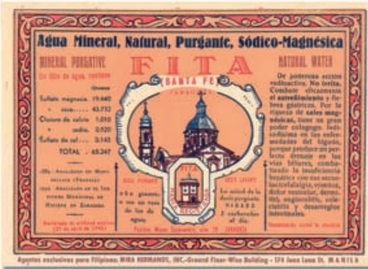
Modelo etiqueta para la venta en Filipinas

reumatismo, estreñimiento, obesidad, piel, riñón, estómago y hemorroides tenía el siguiente modo de uso (según la Guía Oficial de aguas de 1948):