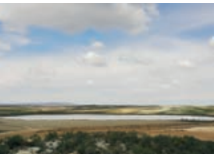
Vista general de la Salada

La laguna Salada de Mediana es un ejemplo del endorreísmo del valle medio del Ebro. Eclipsada por los complejos lagunares de Monegros o Alcañiz, no deja de ser un interesante enclave, tanto histórico, cultural como ecológico, a las puertas de Zaragoza capital.