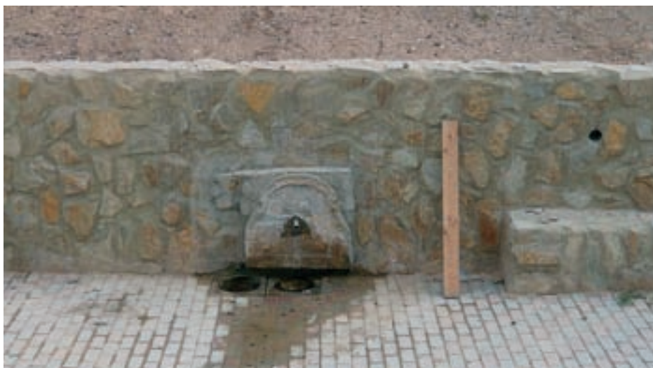
Fuente de La Junquera en la primavera de 2008

Es importante destacar, aunque se explicará con mayor detalle más adelante, que tanto la calidad del agua como su propio caudal están amenazados. En cuanto a la calidad, actualmente presentan una cierta contaminación por nitratos, probablemente de origen agrícola y potenciada por el menor caudal. En cuanto al caudal, la progresiva urbanización de la cuenca receptora de La Junquera está provocando que sea cada vez menor, peligrosamente menor.