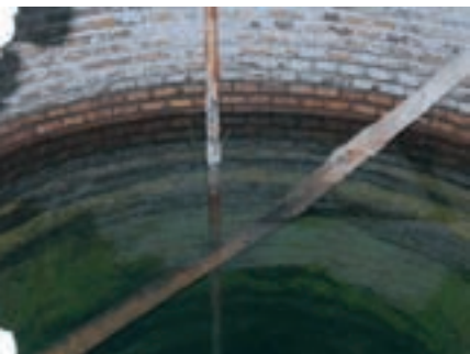
Interior del pozo, donde se aprecia la roca de donde surge el manantial y la tubería de elevación

cho más abundante de 70.000 litros diarios, que parece un tanto excesivo y sin que se sepa el origen exacto de este dato. Tal vez la explicación esté en la edición de 1950-1952 de la Guía Oficial de balnearios y aguas mineromedicinales de España cuando cita un aforo "abundantísimo, existiendo constantemente 70.000 litros para su envase"; un dato que podría hacer referencia más a la capacidad de almacenaje y distribución que al caudal propiamente dicho y que podría haber inducido a esta confusión en publicaciones posteriores. Un estudio más reciente (1999) de la Universidad Complutense de Madrid cifra el caudal en 720 litros/hora, unos 17.000 litros diarios. Un dato que en todo caso, al ser puntual y con el pozo ya en desuso, se debe tomar con mucha precaución, en cualquier caso algo más cercano al caudal oficial originario.