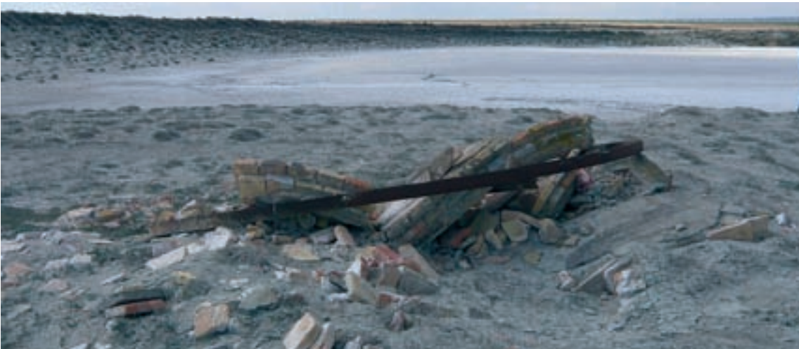
Restos del Pozo Mediana en la actualidad

El momento de máximo esplendor correspondió al cambio de siglo, cuando las aguas y sales de Mediana se comercializaban en Europa y América, llegando a conseguir la Medalla de Oro en la Exposición de París de 1900 y en la Exposición de Aguas Minerales de Génova de 1906.