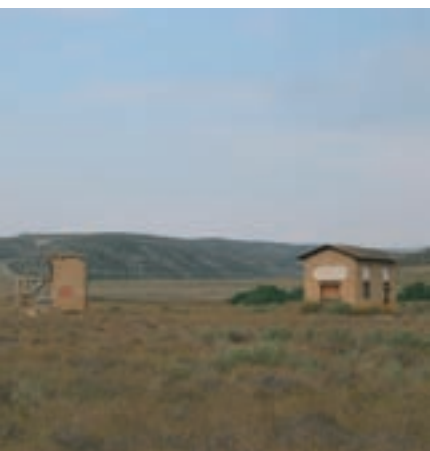
Edificaciones del Agua Fita Santa Fe