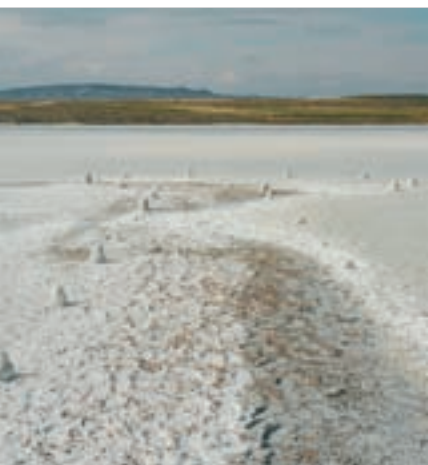
Muelle para extraer la sal

Barrilitos de cartón cuero. Para 3 baños generales – 12 pesetas. Para 5 baños generales – 15 pesetas. Para 7 baños generales – 18 pesetas.