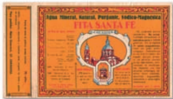
Modelo etiqueta de los años 60-70

El pequeño milagro natural para el hígado