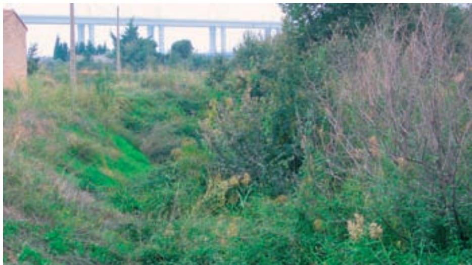
Talud del que mana la Fuente de La Teja

caudal en la época de regadío es muy acusada. El propio Fernando Cámara estimaba el caudal (del conjunto de manantiales de la capa de la que forma parte La Teja) en época de regadío en 60 litros/minuto y de apenas 6 litros/minuto fuera de ese período.