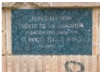
Placa que lucía la fuente en recuerdo de la remodelación de 1981

La Fuente de la Junquera formaba un arroyo desde la fuente hasta el río, dando lugar a una pradera con plantas típicas de zonas encharcadas, entre ellas abundantes juncos que le dieron el nombre.