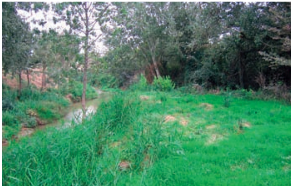
Pradera a orilla de la Huerva, junto a la fuente de La Teja

La Fuente de La Teja se encuentra en la margen derecha de la Huerva, a escasa distancia del núcleo de Zaragoza.