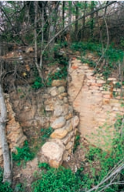
Restos de muro en la salida del manantial