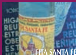
FITA SANTA FE