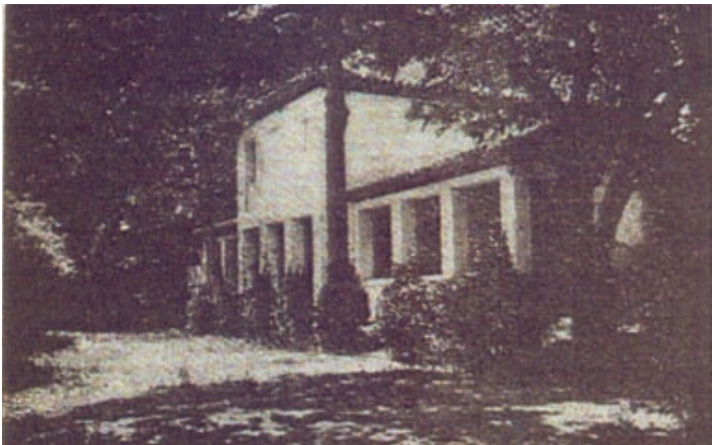
Balneario de la Fuente de la Salud en 1903