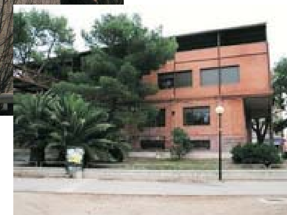
BPM Javier Tomeo