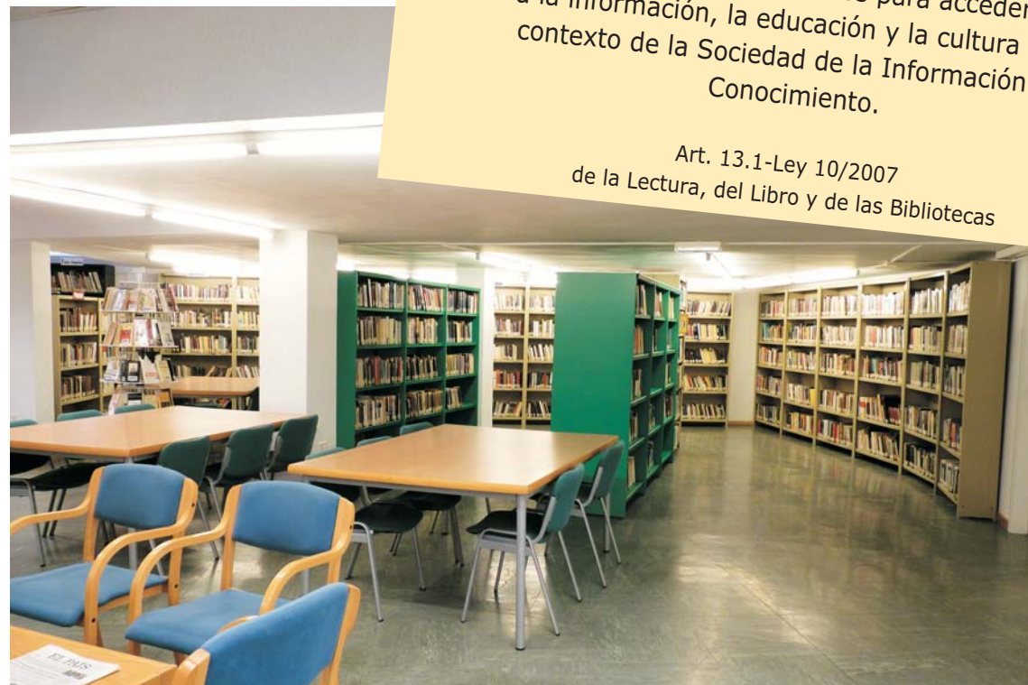
BPM Santa Orosia

Art. 13.1-Ley 10/2007 de la Lectura, del Libro y de las Bibliotecas