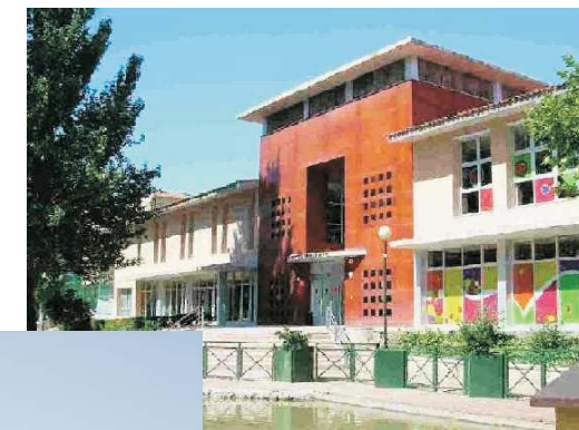
BPM Soledad Puértolas