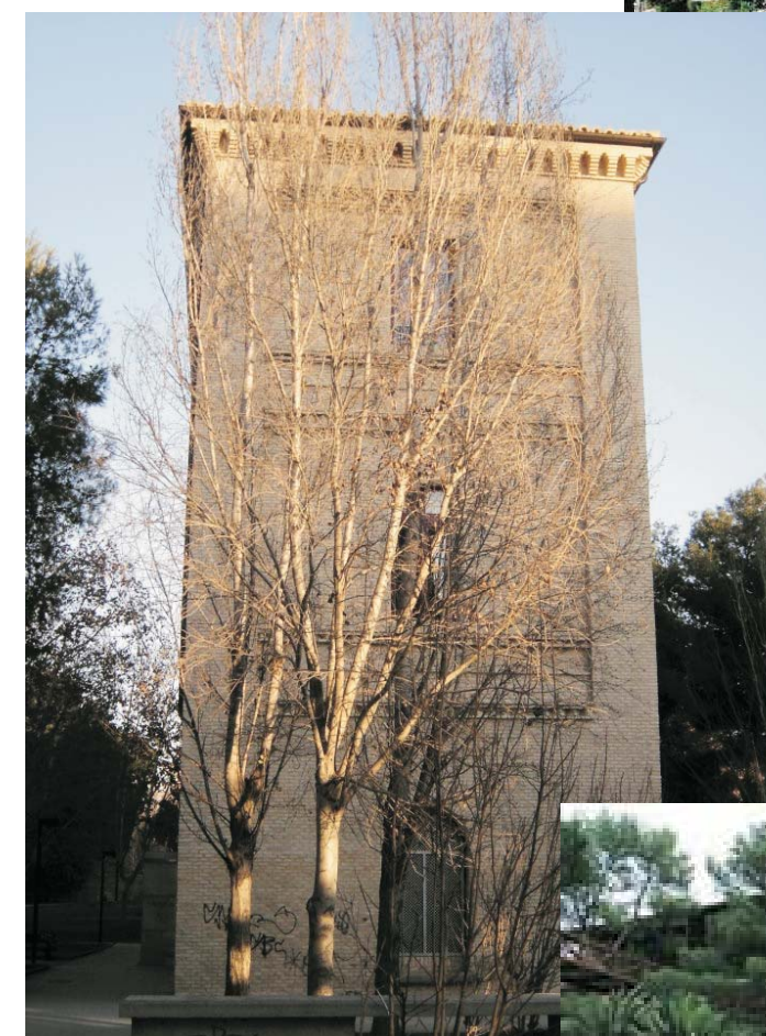
BPM Manuel Alvar