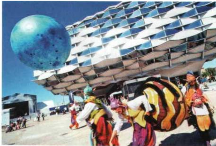
† Burlesk theater voor het paviljoen van Aragon, dat wonderlijk op drie poten staat

Ik wijk uit naar het Russisch paviljoen. De bistro biedt een klassemenu met blini's en kaviaar uit de Kaspische Zee. Om dit te begieten, is er wodka van berkenhout, peper of honing.