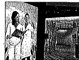
Auf Leinwänden begleiten Wia und Wat die Gäste des Deutschen Pavillons

Ein weiterer deutscher Beitrag zum Umweltschutz stammt vom Partner des Deutschen Pavillons