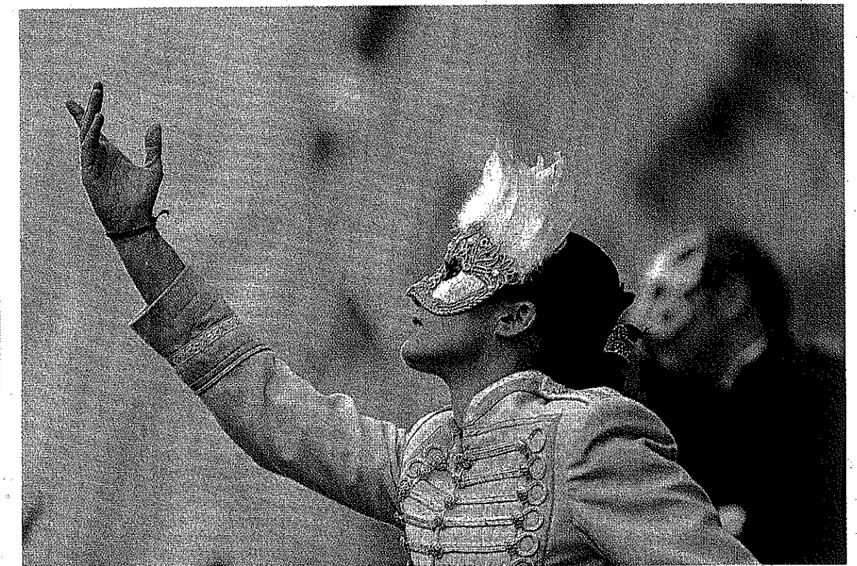
Straßenspektakel gehören zur Stadtsicht in Saragossa, der Hauptstadt Aragoniens.

ausstellung 2008 vor – Historische Wurzeln werden nicht vergessen