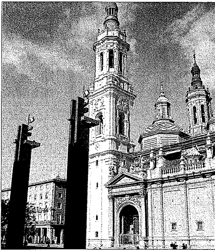
Die Basilica del Pilar - barockes Juwel am Pilarplatz.

Während im Herzen Saragossas Vergangenheit und Gegenwart einträchtig ihren gemeinsamen Alltag leben, richtet sich nur wenige Kilometer außerhalb der Blick in die Zukunft. Dort, wo der Ebro zu einem gewaltigen Mäander ausholt, nimmt im Innern der Flusschleife ab Mitte Juni eine Weltausstellung Platz, die Expo Zaragoza 2008. Auf 25 Hektar Fläche greifen Aussteller aus über 100 Ländern das Thema „Wasser und nachhal-