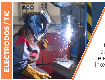
ELECTRODOS / TIG