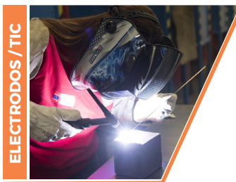
ELECTRODOS / TIG