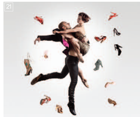
21 LA CENICIENTA