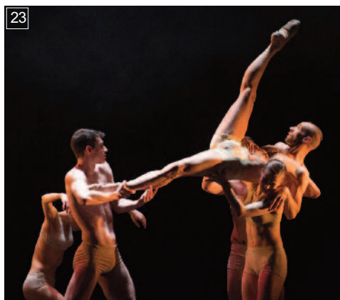
23 CARNE CRUDA