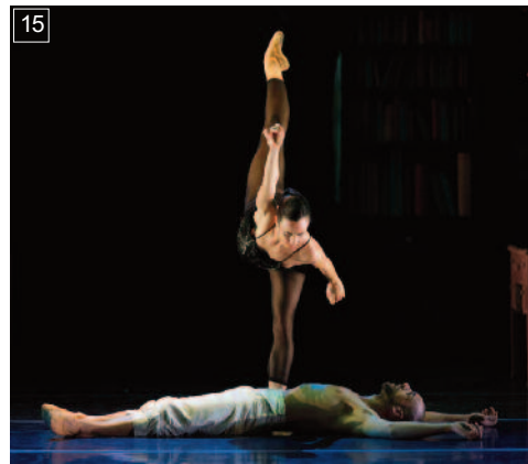
15 CUENTO DE NAVIDAD