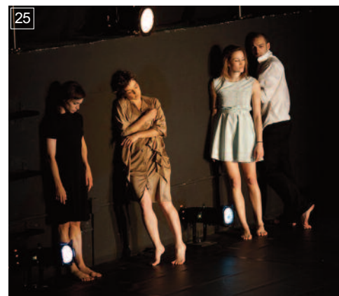
25 WORK IN PROGRESS