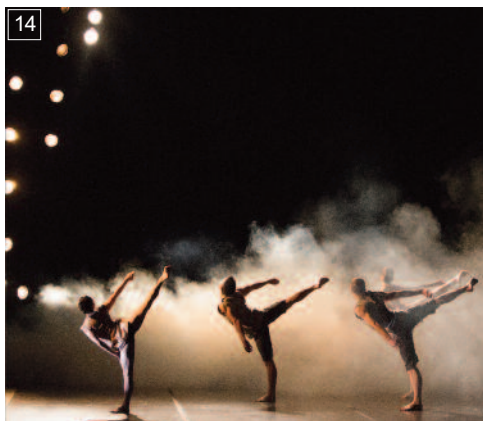
14 THE GRAMMAR OF SILENCE