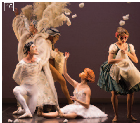
16 EL CASCANUECES