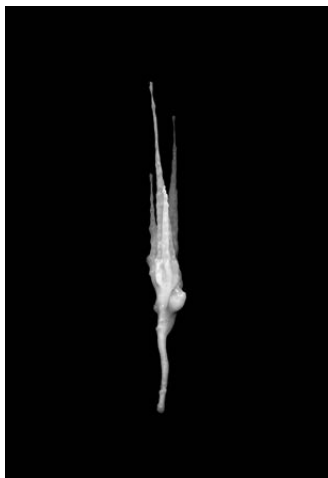
Señor Cifrián Estalactita # 7 , 2015 Fotografía, 49,5 x 34,5

proyecto. En su trabajo –fotografía, collage, escultura-intervención– es esencial el proceso. Desde la reflexión del contenido, los materiales, los procedimientos, hasta la exhibición. Muchos de sus trabajos se conciben en series, lo que les permite explorar al máximo las posibilidades. Su reflexión plástica se nutre de lo sencillo para penetrar en la memoria y el tiempo, a través de un lenguaje con múltiples lecturas.