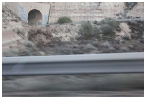
Victor Solanas-Díaz 1h 17 min 42 s , 2016 Instalación (detalle)