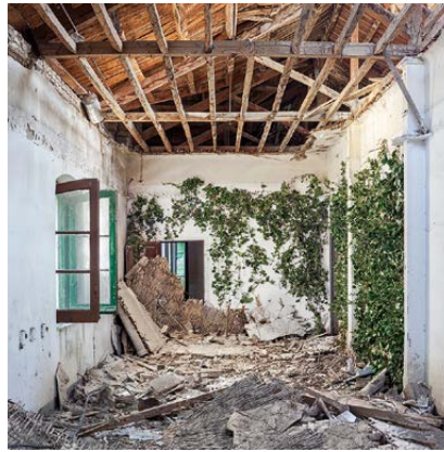
David Latorre A flor de piel II , 2016 Fotografía, 120 x 120

David LATORRE (Huesca, 1973) trabaja la fotografía junto con la intervención en el espacio, a través de proyectos que se extienden y desarrollan en el tiempo como ocurre en Escenarios de Conducta . Espacios desiertos, abandonados, castigados por el olvido que reconstruye creando una realidad paralela. Su trabajo se centra en la documentación, la alteración y la intervención crítica. Persigue remover el peso del sectarismo y la animosidad colectiva a partir de lugares y circunstancias que no deben relegarse al olvido de un pasado reciente. En su último proyecto reflexiona sobre las fronteras.