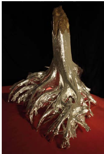
Nacho Arantegui 1900 1, 2°C , 2017 Instalación, 420 x 250 x 300

Nacho ARANTEGUI (Zaragoza, 1970), es un artista multidisciplinar. Su trabajo se define en lo que el mismo ha dado en llamar veladas . Experiencias en las que están presentes el canto, la música, la danza, la intervención en el espacio, la escultórica, la performance ... Un canto sensorial, poético y reflexivo, en el que interactúa con los espacios naturales. Se define como un artista entroncado en la corriente land art , aunque su obra va más allá. Sus obras son una respuesta a como él vive su relación con el entorno natural. Una evocación que invita a reflexionar sobre la frágil relación del hombre con la naturaleza.