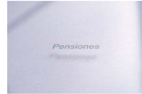
Julia Puyo Estado del bienestar (fragmento) , 2016 Grabado sobre cristal, 185 x 70

que vierte una crítica hacia quienes quieren domeñar la facultad del pensamientos, con falsas falacias que enturbian el conocimiento. Artista visual utiliza el videoarte, la instalación, o el diseño gráfico para desarrollar su discurso. Abierta a nuevas formas de expresión, pero rigurosa en el tratamiento, su obra reflexiona de manera crítica sobre la sociedad, la política, los medios de comunicación y el poder del estado.