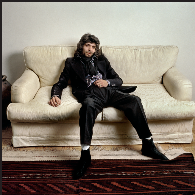
Camarón de la Isla . Madrid, 1986

Es otra de las características del estilo Conesa: la eficacia. Con muy poco tiempo, con muy poco dinero, con muy poca puesta en escena..., consigue definir a sus modelos.