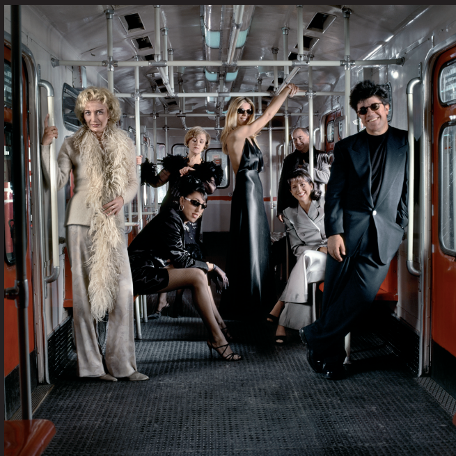
Troupe Almodóvar . Madrid, 1995

Nacido en la prensa y gracias a la prensa –y más concretamente a las revistas– Chema Conesa crea y desarrolla un estilo propio, íntimamente ligado al hecho editorial. Sus retratos son encargos; están pensados para ser publicados y se realizan en las circunstancias más inesperadas. El fotógrafo siempre tiene la habilidad de transformar los problemas en sugerentes soluciones.