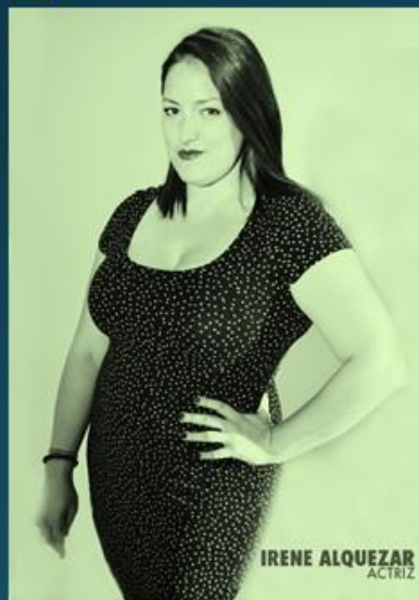
IRENE ALQUEZAR ACTRIZ