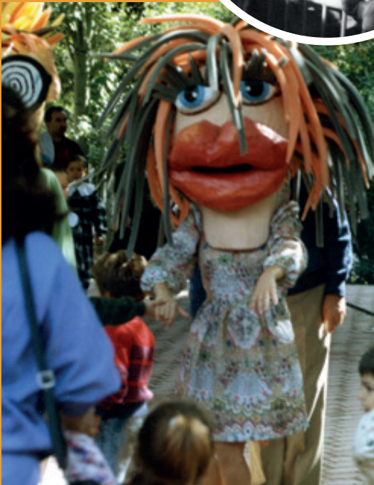
Parque Bruil, 1992. ↑