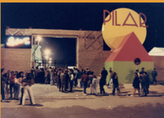
Pabellón de Festejos de la antigua Feria de Muestras, 1990. ↓