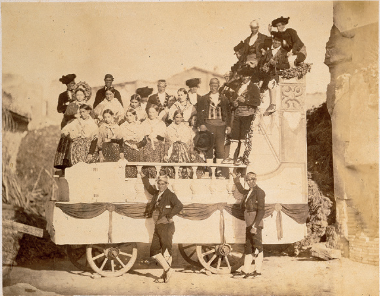
ZARAGOZA. UNO DE LOS CARROS TRIUNFALES QUE PRECEDIAN A S. S. M. M. al entrar en la ciudad.

↑ Charles Clifford, 1860, Biblioteca Nacional.