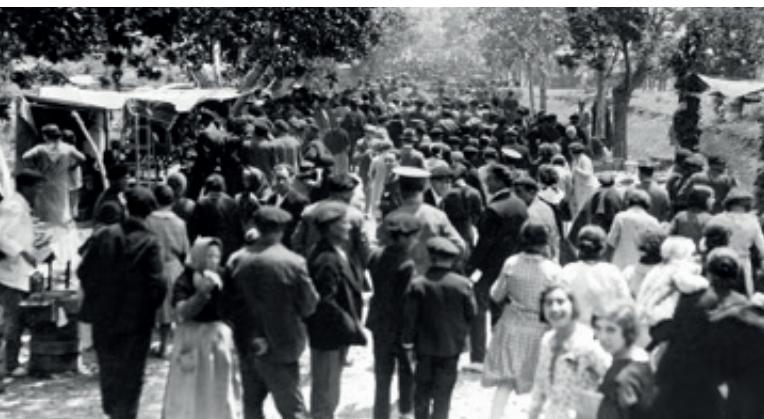
Recinto ferial de Santa Engracia, 1920. ↓

Fiestas de contrastes. Las fiestas de "unos" y "otros". Del negro al gris con luces de neón. Reina de las Fiestas y galas de proclamación. Pregones y cabalgatas. Nueva comparsa de Gigantes y Cabezudos. La ofrenda de Frutos y la ofrenda de Flores. Jotas y folclore. Teatro revista y variedades. Festivales cómico-taurinos. El Empastre. Ferias y Circos. El Teatro de Manolita Chen. Las Majorettes. El deporte en fiestas: motonáutica; ciclismo y motos.