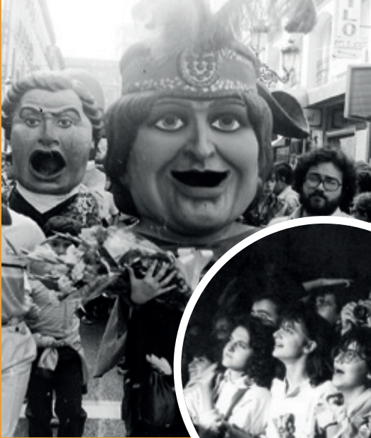
Bautizo de La Pílara, 1982. ↓