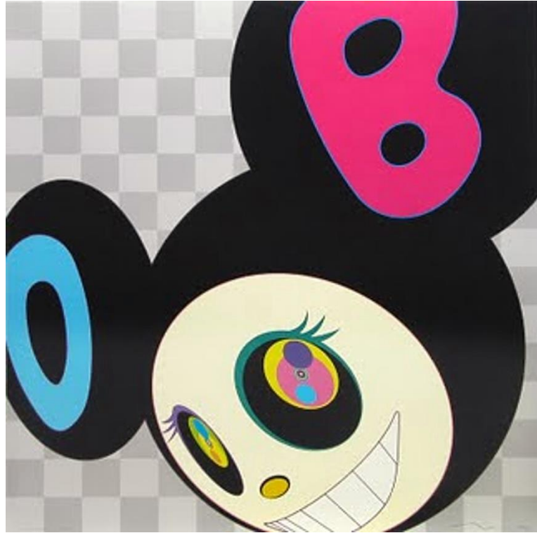
Takashi Murakami, And Then Black (2006)