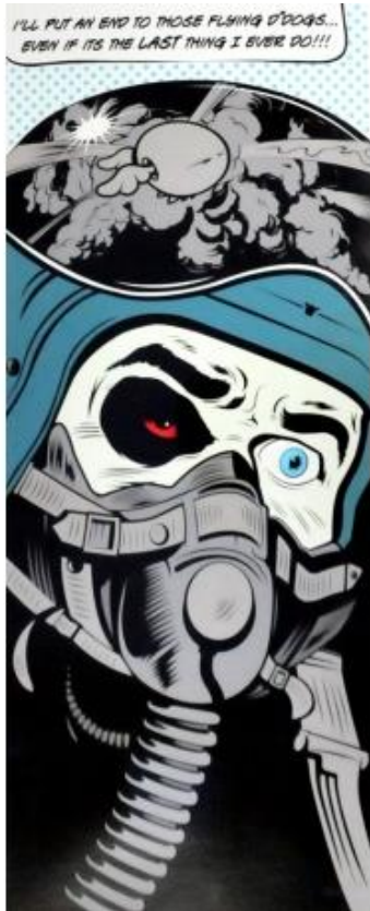
D-Face, End to those dogs (2015)