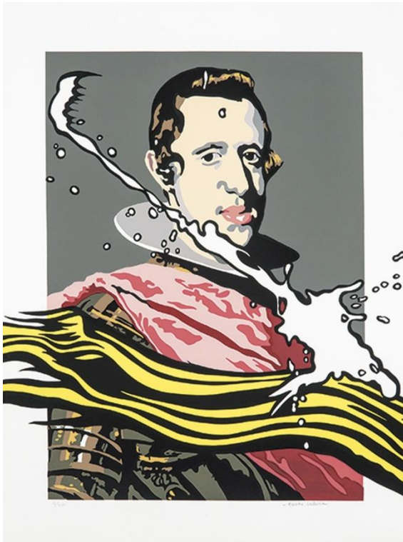
Equipo Crónica, Felipe IV y la pinclada (1972)