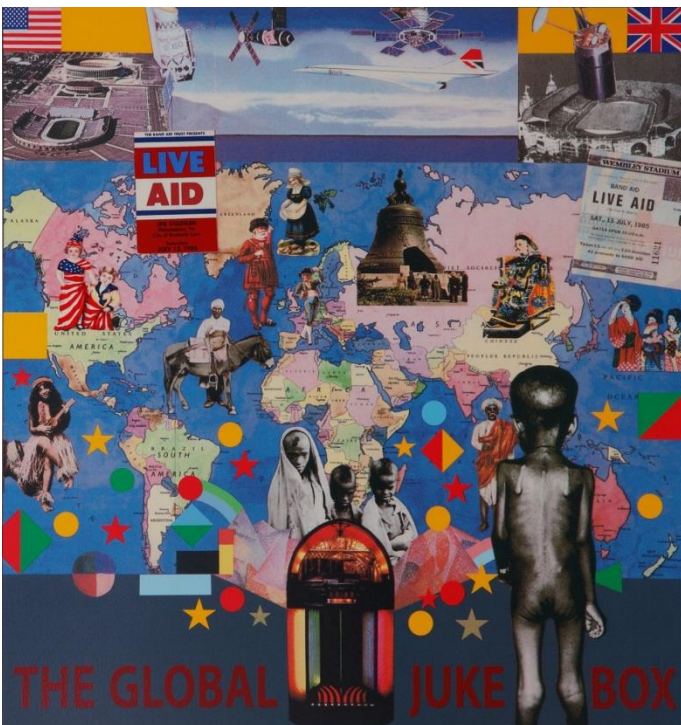
Peter Blake, Live Aid (2005)