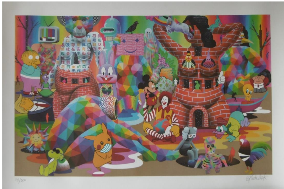
Okuda, Quarantine Dreams (2020)