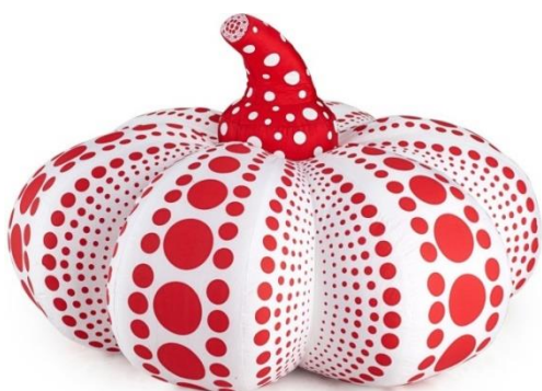
Yayoi Kusama, Pumpkin plush red (2004)