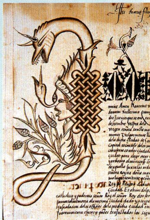
Libro de Actas Comunes 1531-1532 [ L.A. 23 ]