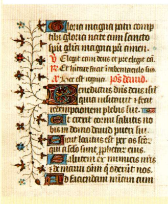
Página del Salterio , manuscrito circa 1500 [ Signatura Ms 20 ]